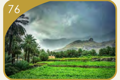
السياحة في ستال

أصايل للصحافة و النشر ش.م.م Assayel for Press & Publishing L.L.C