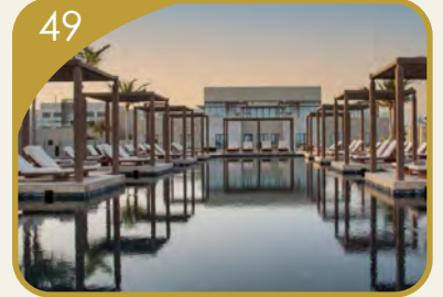
منتجع أليلا حينو جنة عشاق الطبيعة