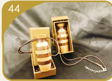
سلطان للحرف اليدوية الخشبية