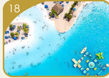
إطلاق مشروع النخيل