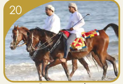
نادي أصايل ينظم عرضة الخيل