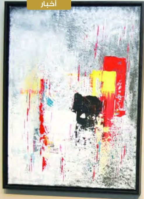
عبدالله الحمادي لوحة بروتيرية والألوان زيتية 1998