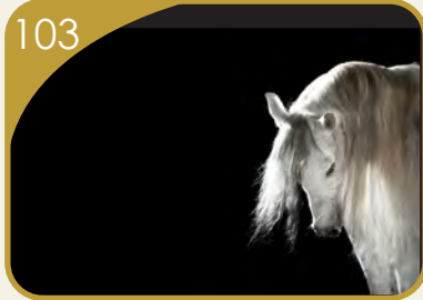
المعايير الصحية لشراء الخيل