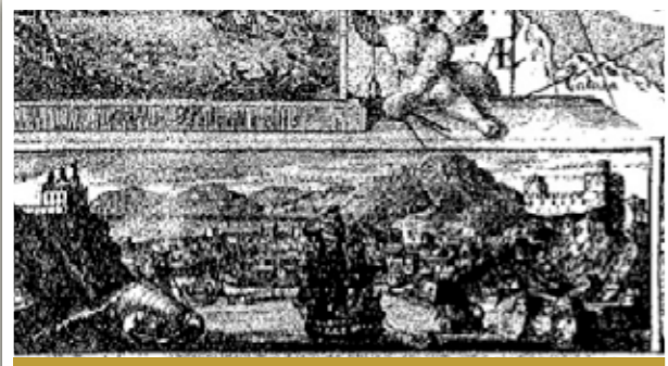
رسم آخر للرسام الرحالة الدبلوماسي إنجلبرت كامبفر لمسقط عام ١٦٨٨م

و يعرج (انجلبرت) الى وصف الإنسان العُماني في تلك الحقبة ولباسه حيث يشير إلى أن العمانيين كانوا نحاء الأجسام ولبسوا جلابيب فضفاضة و يلبسون الخناجر وعمائم بيضاء يتدلّى طرف منها، ويحملون سيوف طويلة وبنادق طويلة جداً.