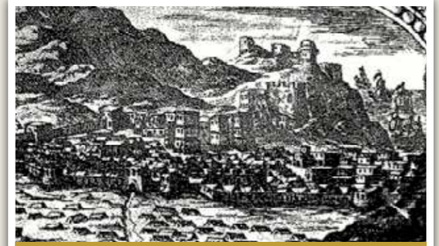
اللوحه التي رسمها إنجلبرت كامبفر لمسقط عام ١٦٨٨م

في الختام لا بد من الإشارة الى عدد من النتائج التي يمكن استخلاصها ولا سيما أهمية كتابات الرحالة الأجانب في ايضاح صورة التاريخ العُماني كون كتاباتهم تعتمد على المشاهدات، وتهتم بالعادات والطقوس وغيرها. كذلك لا بد من الاشارة الى المرحلة المتطورة التي عاشتها عُمان في ظل الدولة اليعربية، وما واكب ذلك من حراك سياسي واقتصادي عاشته عُمان؛ مما جعل الكثير من التجار من مختلف الأقطار تتوافد عليها، وجعلتها محطة للجوء السياسي كما حدث مع ابن السلطان أكبر سلطان المغول الذي قدم إلى عُمان و سلمه الإمام إلى أبيه.