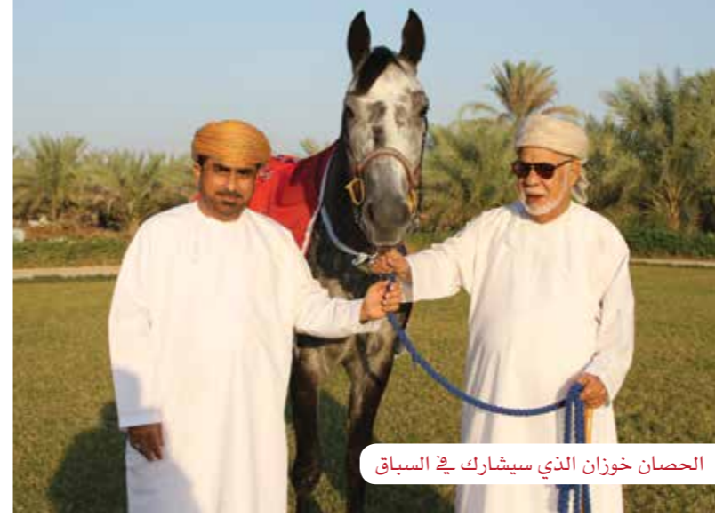
الحصان خوزان الذي سيشارك في السباق